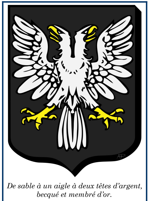
De sable à un aigle à deux têtes d'argent, becqué et membré d'or.