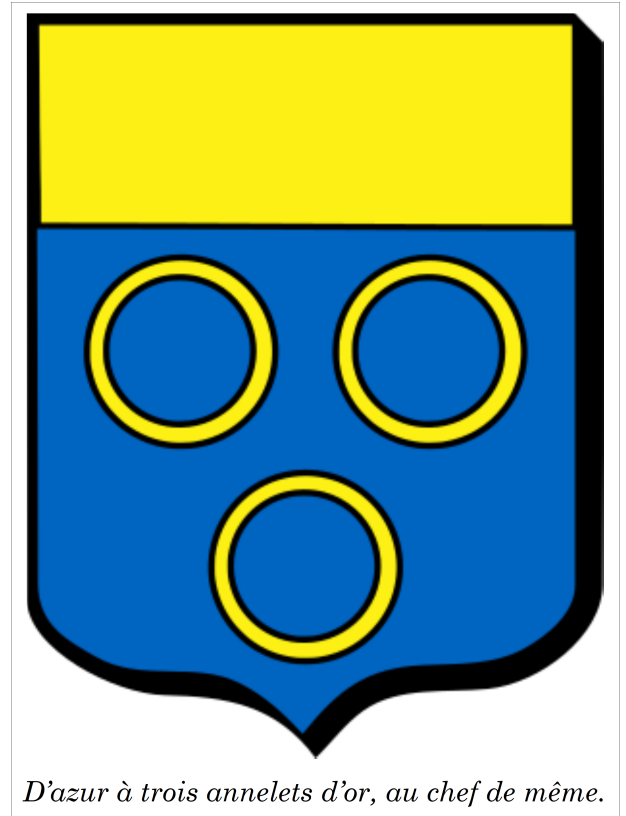
D'azur à trois annelets d'or, au chef de même.