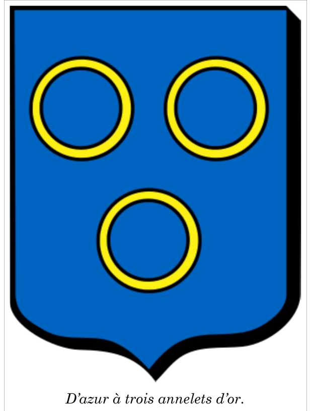
D'azur à trois annelets d'or.