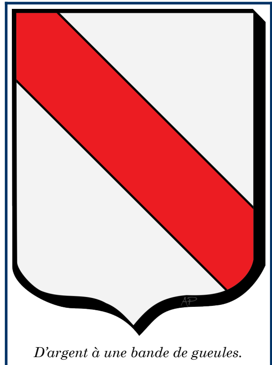
D'argent à une bande de gueules.