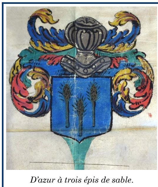
D'azur à trois épis de sable.

Lequel Jan de Lochan cadet transporta sadite maison de Lochan, l'une des plus entiennes maisons de noblesse et mieux marquées en l'église parochiale dudit Irvillac en l'an 1522 au seigneur vicompte du Fou, ensemble avecq ses autres herittages.