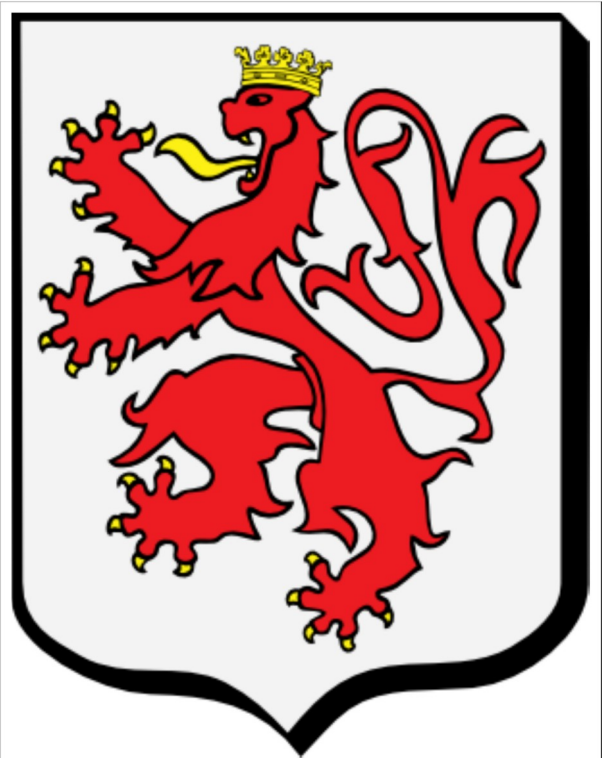
D'argent à un lion de gueules armé, lampassé et couronné d'or.

Transaction faite le treizieme de juin de l'an mille six cens dix sur le par-