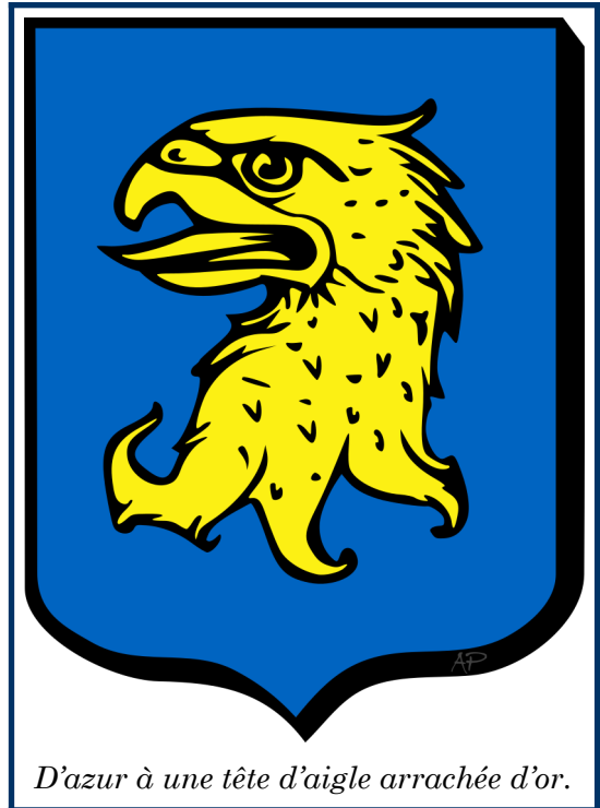
D'azur à une tête d'aigle arrachée d'or.